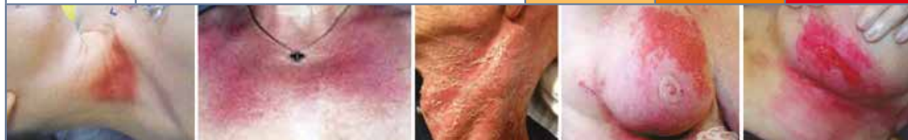
Tableau I : Prise en charge en fonction de la classification de la gravité de la radiodermite.