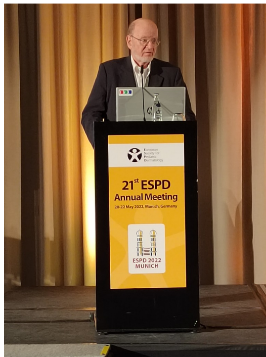
Pr Rudolf Happle