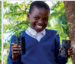
Afrique du Sud