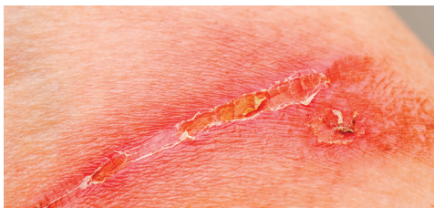
IRRITATIONS, ÉCHAUFFEMENTS, ROUGEURS