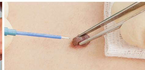
POST ACTE ESTHÉTIQUE